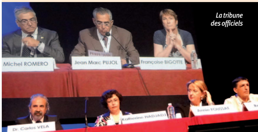
La tribune des officiels