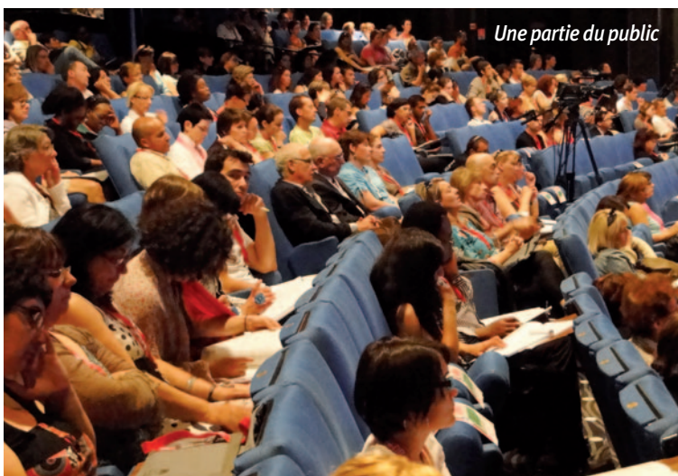
Une partie du public