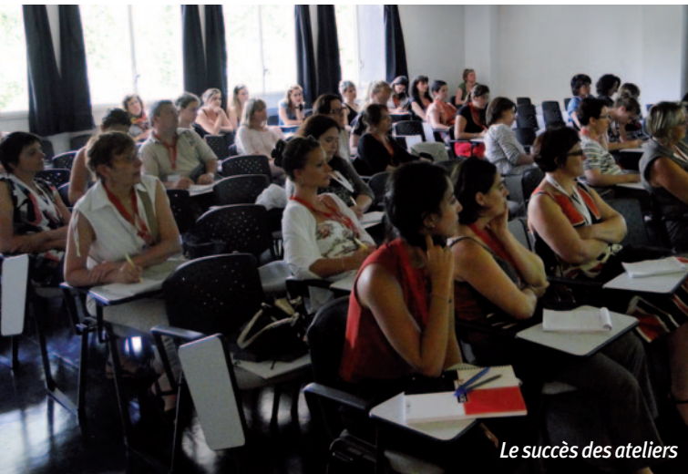
Le succès des ateliers

L es Sessions éducatives et les ateliers ont eu, comme d'habitude, beaucoup de succès. Toutes les salles étaient très pleines. Nous remercions les sociétés Bernas, Genzyme & MACSF qui ont contribué à la formation des Infirmier(ère)s en organisant leur Session Éducative.