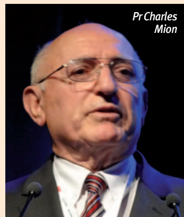
Pr Charles Mion