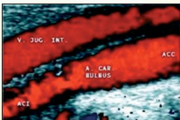
Flux jugulaire interne ascendant

Les sténoses des veines centrales peuvent être à l'origine de très nombreuses complications qui en règle n'apparaissent qu'après création d'une fistule artérioveineuse homolatérale :