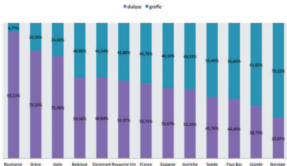
L'insuffisance rénale terminale en Europe Modalités de prise en charge des patients en IRCT en Europe en 2008

En effet, les pays qui, comme la France, ont adopté ce principe du consentement présumé ont une activité de prélèvement nettement supérieure à ceux où l'on a opté pour le "consentement explicite" (le prélèvement ne peut se faire que si la personne a indiqué clairement, de son vivant, son souhait de faire l'objet d'un prélèvement en cas de décès).