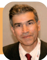
L'insuffisance rénale chronique en France